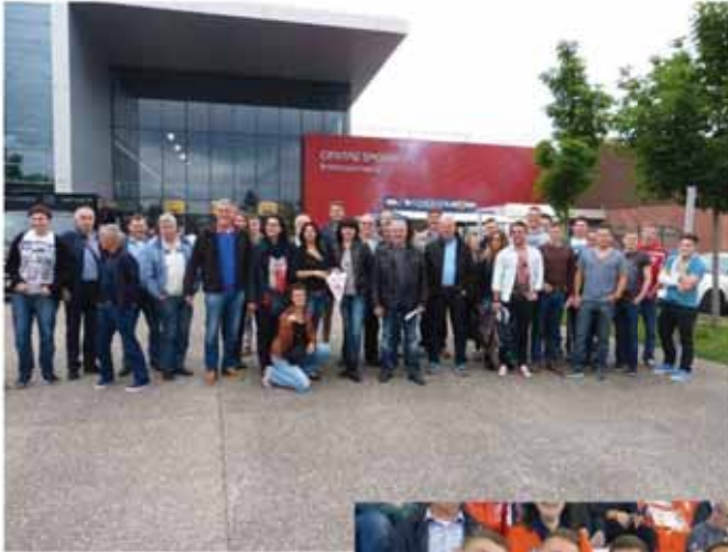
Selestat und Nimes.

Zum Saisonabschluß fuhr eine TuS- Gruppe nach Selestat und besuchte das Spiel der 1. Franz. Liga zwischen