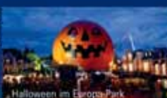
Halloween im Europa-Park