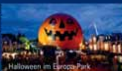
Halloween im Europa-Park