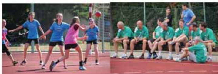
Die junge und ältere Generation zeigte ihr Können.